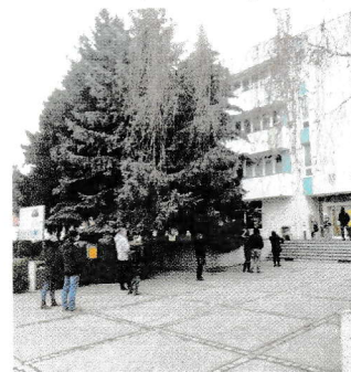
Počas prvého kola testovania.

firmách? „Dnes nemám vedomosť o tom, že by firmy testovali, ale v stredu 3. februára budem mať s firmami videokonferenciu, kde budem rokovať o zriadení druhej mobilnej odberovej jednotky, ktorá by bola umiestnená v priestoroch priemyselného parku. Budem tiež hovoriť s predstaviteľom firmy SWOT, ktorá sa podujala toto miesto prevádzkovať,“ odpovedá primátor. „Firmy vítajú túto iniciatívu. Je, prirodzene, potrebné doladiť niektoré dôležité ‚detaily‘, ako je financovanie či zabezpečenie osobných ochranných prostriedkov, testov, zdravotníkov, a tak ďalej,“ dodal.